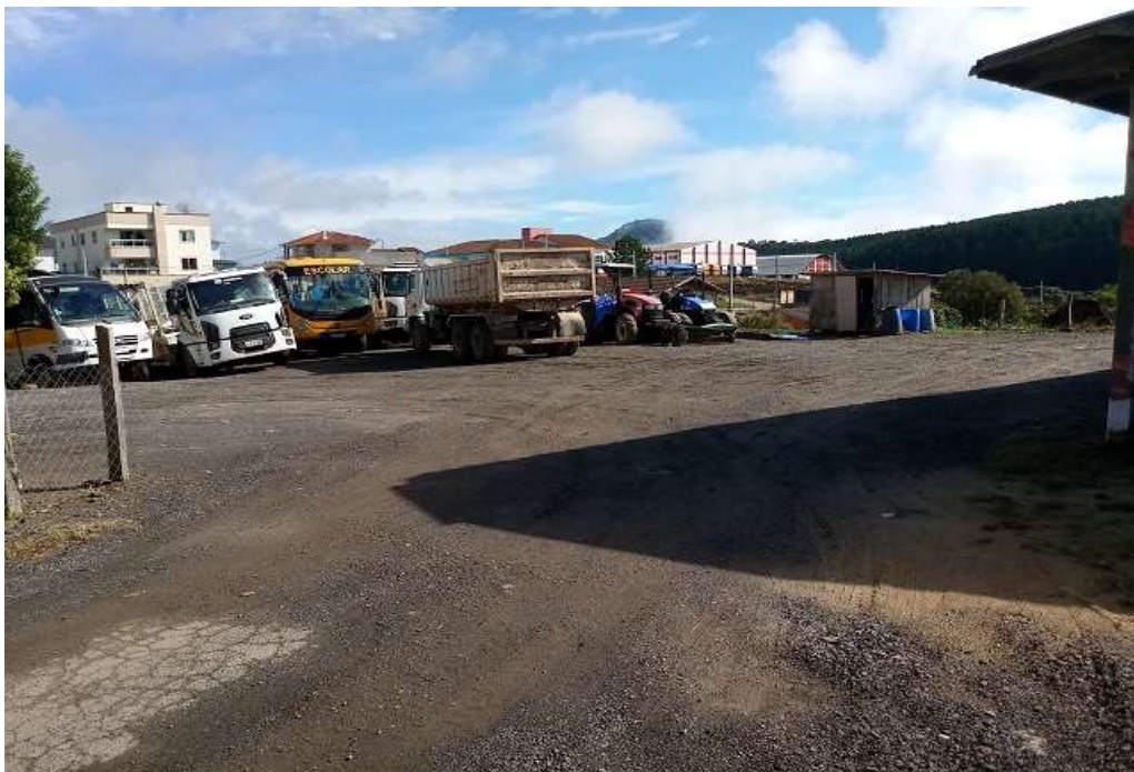
Pátio atrás da Prefeitura Municipal