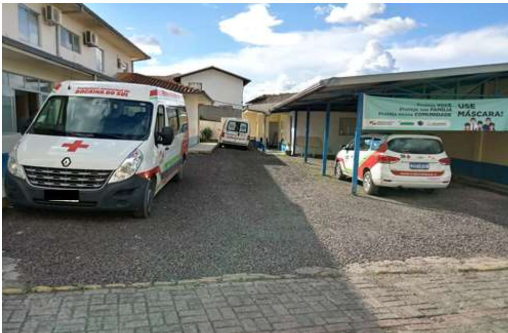
Pátio da Secretaria de Saúde