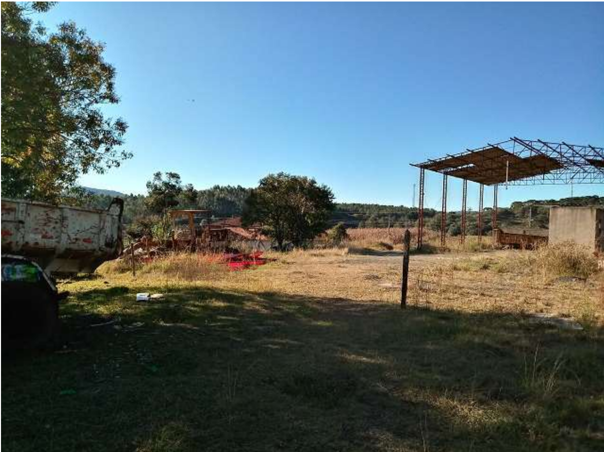
Terreno ao lado da Creche do “Bolinha”