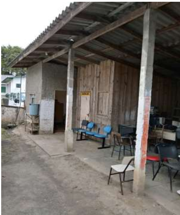
Área externa do local