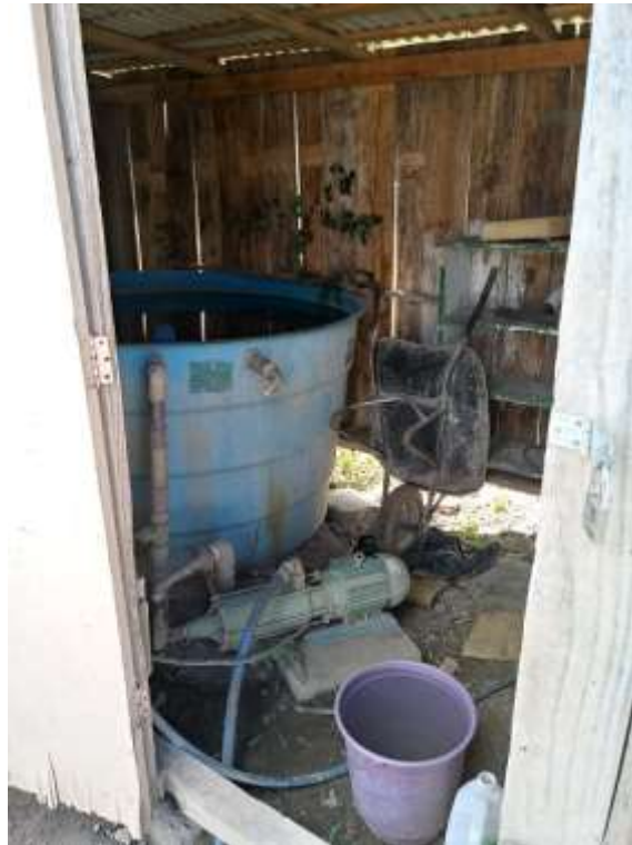
Fundos do pátio da Prefeitura Municipal