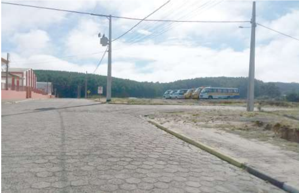
Terreno em frente E.B.M. Padre Theodoro Bauschulte