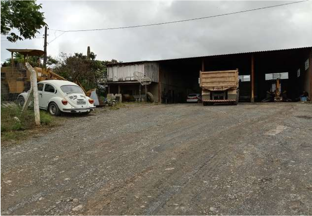
Pátio da Oficina Mecânica Municipal