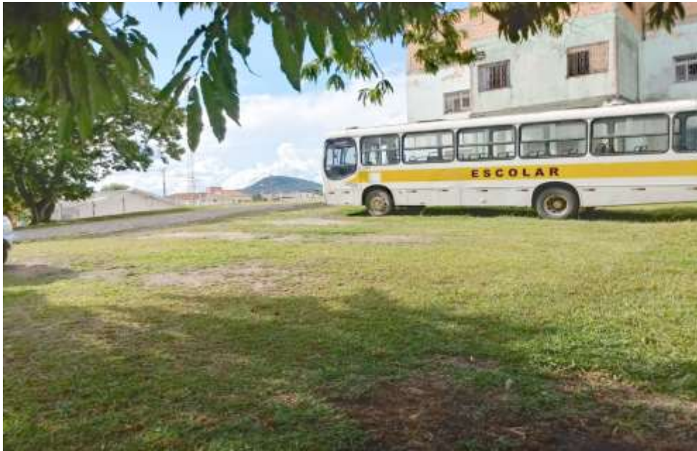
Pátio do antigo Hospital São José