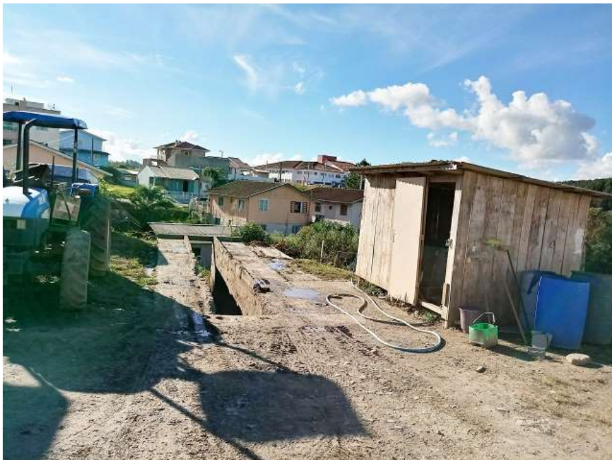
Fundos do pátio da Prefeitura Municipal