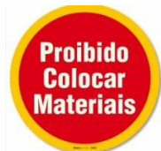
Exemplo de placa de sinalização "proibido colocar materiais".