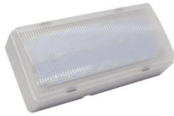
Exemplo de iluminação de emergência.