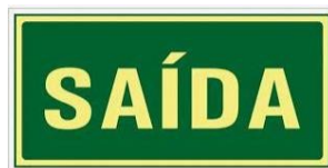
Exemplo de placa de saída fotoluminescente