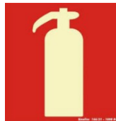
Exemplo de placa de sinalização de extintor.