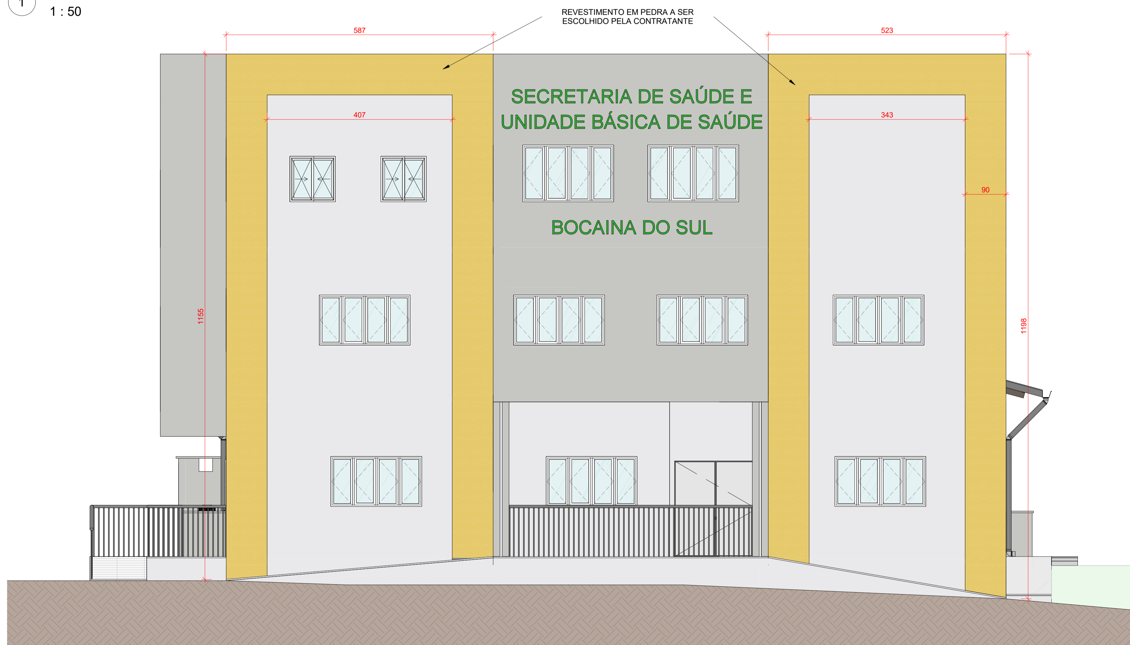
2 FACHADA OESTE 1 : 50